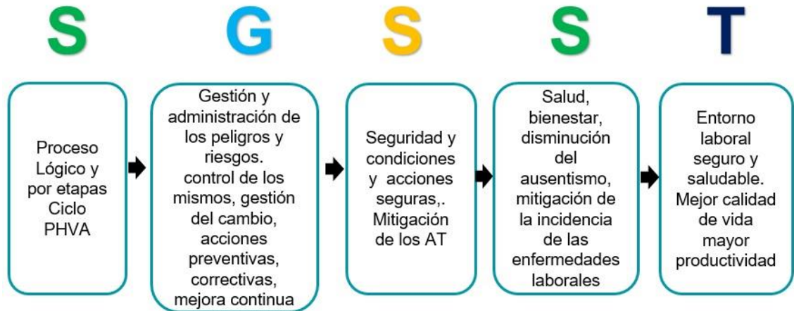
Imagen 2. Descripción SG-SST.

Acorde con los resultados obtenidos en el diagnóstico inicial y definiendo las áreas que se interrelacionan entre los procesos de Capacitación y Seguridad y Salud en el Trabajo; se definen los siguientes ejes de intervención para el SG-SST